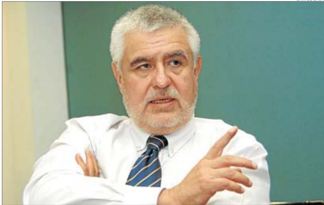
L'epidemiòleg afirma que l'OMS ha reaccionat equilibrant la cautela amb el problema.

R Sí. Crec que es va considerar erròniament (això està clar) que es tractava d'una reactivació de la grip estacional. Possiblement per això va ser limitada l'atenció que es va prestar a les evidències que estaven sorgint, particularment a Veracruz i a Oaxaca. Quan es va veure que es tractava d'una cosa extraordinària, era una mica tard. De totes maneres, es va corregir el camí.