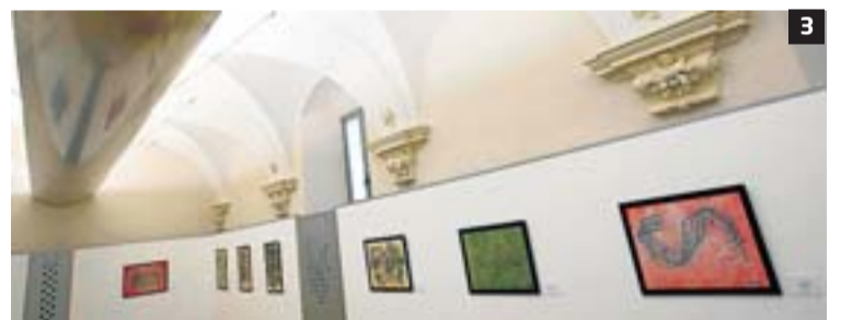
► DUES SÈRIES, GAIREBÉ 100 OBRES. És el que va sortir després d'una bona colla de setmanes enllitat al Trueta. 1 DIT-1 és el títol d'aquesta obra, que forma part de la sèrie El traç del dit . 2 La segona sèrie que va confeccionar s'anomena Adorns , i la integren una setantena de pintures, entre les quals la de la imatge, ADORN-22 . 3 Les pintures són ara a l'Espai del Metge i la Salut Rural.